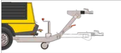
Регулируемое по высоте дышло со стояночным и инерционным тормозом наката