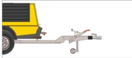
Нерегулируемое дышло с инерционным тормозом наката и стояночным тормозом