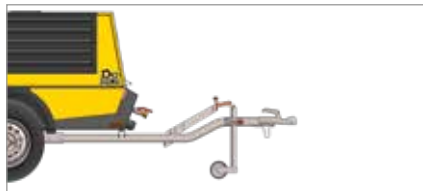
Нерегулируемое дышло без инерционного тормоза со стояночным тормозом наката